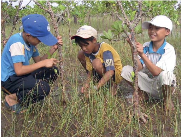
Trẻ em tham gia bảo vệ rừng ngập mặn - Việt Nam