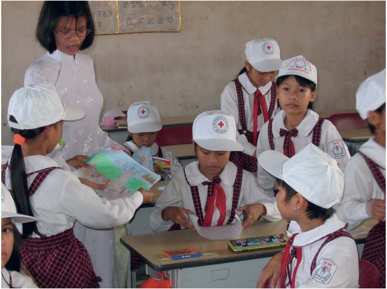
Vẽ tranh trồng rừng ngập mặn - như là biện pháp DRR ở Hải Phòng, Việt Nam - IFRC