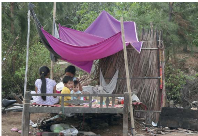
Trẻ em không có nơi tạm trú sau bão số 10, năm 2006 tại Bến Tre, Việt Nam

Người khác: Bạn không muốn nghe một đứa trẻ nói về chủ đề này. Bạn không chú tâm tới việc dành chút thời gian lắng nghe những bài học “đơn điệu và nhạt tẹt” này.