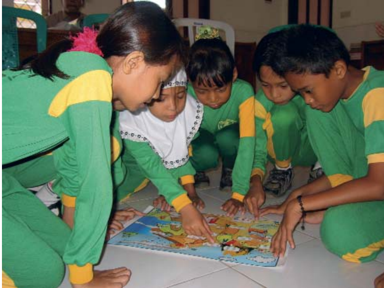
Thông qua trò chơi học sinh học về hiểm họa và rủi ro ở địa phương

Trong khi ưu tiên số 1 và số 3 cần có sự tham gia vào các hoạt động liên quan tới giáo dục chính quy, những hoạt động này có thể hỗ trợ cho những sáng kiến giáo dục không chính quy về DRR và những sáng kiến này là yếu tố căn bản của việc thực hiện các ưu tiên số 2 và số 4. Phương thức tiến hành mà Chương trình Hành động Băng- Cốc nhấn mạnh là: giáo trình giảng dạy; an toàn trường học và nâng cao năng lực cho cộng đồng và trẻ em (bao gồm cả những nhóm như trẻ em có nhu cầu đặc biệt và trẻ em không đến trường) có một cách tiếp cận toàn diện và dựa vào quyền trẻ em.