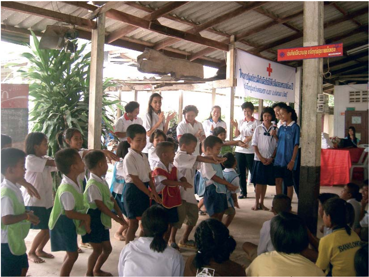
Giáo dục DRR ở một số trường ở Thái Lan